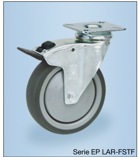
Serie EP LAR-FSTF