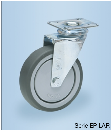
Serie EP LAR