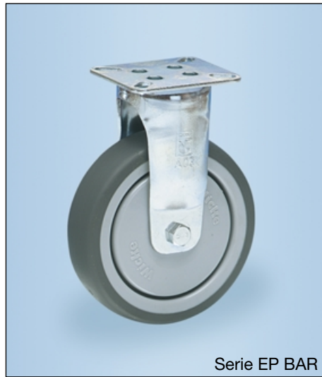
Serie EP BAR