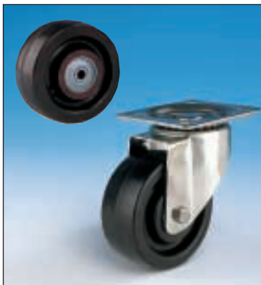
Reinforced phenolic resin, with glass fibre, ball bearings (no maintenance) with inox plate / Verstärkt phenolharz mit Glasfaser, Rillenkugellager (kein Instandhaltung) mit inox Gabel