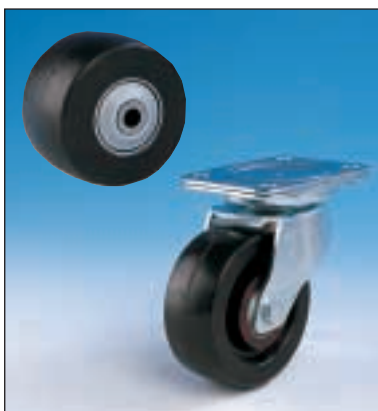
Reinforced phenolic resin, with glass fibre, ball bearings (no maintenance) with protected zinc plated swivel head with grease nipple / Verstärkt phenolharz mit Glasfaser, Rillenkugellager (kein Instandhaltung) mit abgedichteter Gabelkopf mit schmirnippel