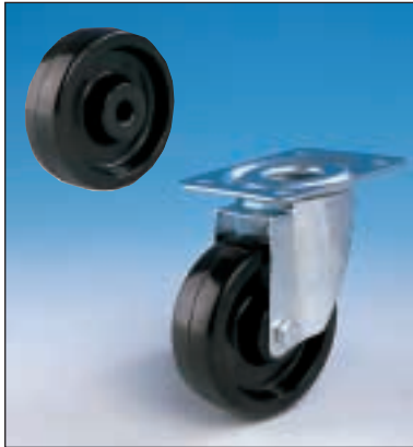
Standard phenolic resin, plain bore, with zinc plated / Standard phenolharz-Gleitlager mit verzinkter Gabel