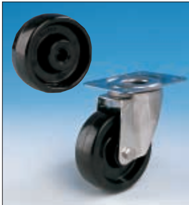
Standard phenolic resin, plain bore, with inox plate / Standard phenolharz-Gleitlager mit inox Gabel